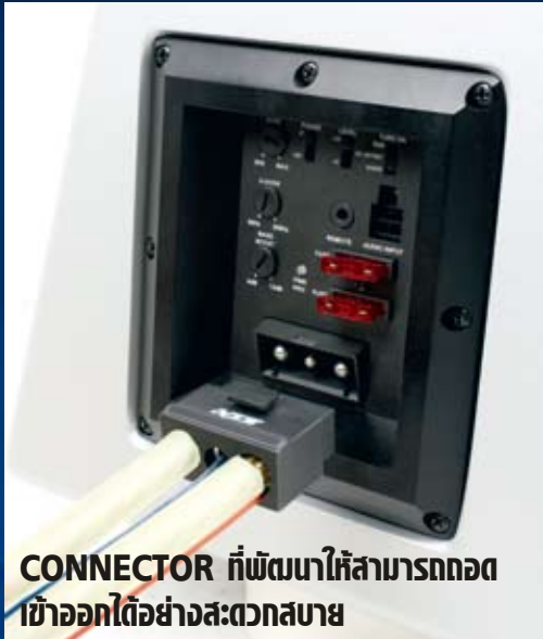
CONNECTOR ที่พัฒนาให้สามารถถอด เข้าออกได้อย่างสะดวกสบาย